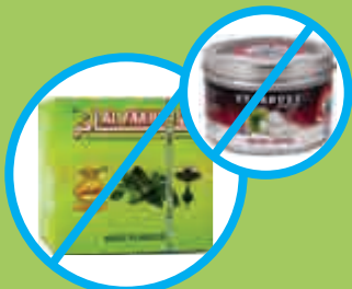
“青苹果”(Sour Apple)为水果味; “清凉型”(Mint)有独特的味道和香气。