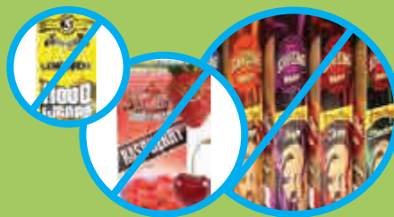
“柠檬水”(Lemonade)为水果味饮料; “覆盆子”(Raspberry)、“蓝莓”(Blueberry)、“橙子”(Orange)、“葡萄”(Grape)、“樱桃”(Cherry)和“草莓”(Strawberry)为水果味。