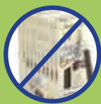
单支或整包出售; 添加香料者禁止出售。