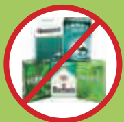
“薄荷”(Menthol)有独特的味道和香气。