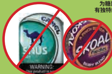
“浆果”(Berry)为水果味; “清凉型”(Mint)有独特的味道和香气。